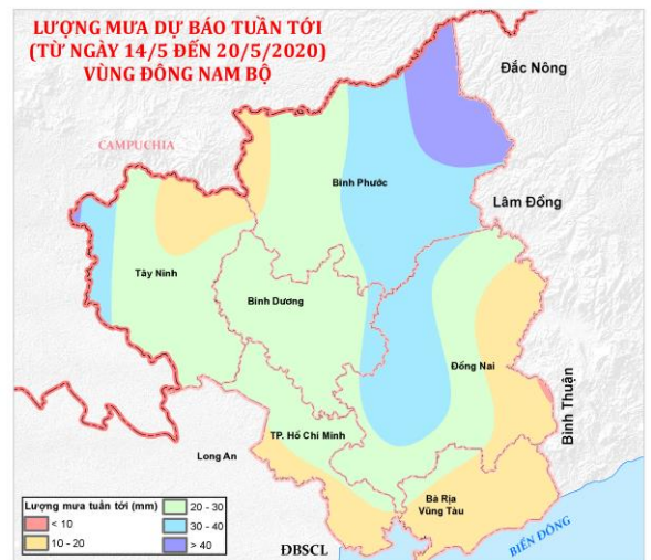
Hình 1: Phân bố lũy tích mưa tuần qua, lũy tích mưa từ đầu năm và dự báo mưa tuần tới vùng Đông Nam Bộ