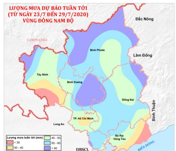
Hình 1: Phân bố lũy tích mưa tuần qua, lũy tích mưa từ đầu năm và dự báo mưa tuần tới vùng Đông Nam Bộ