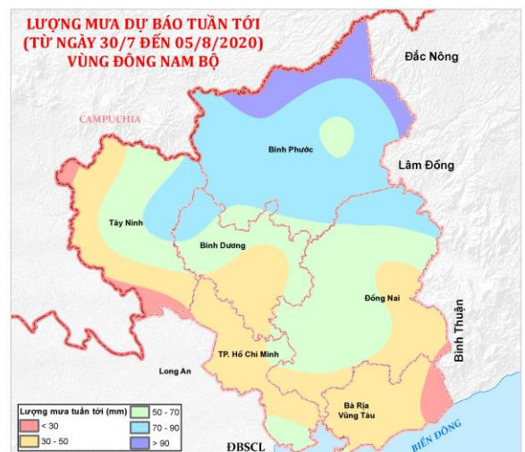
Hình 1: Phân bố lũy tích mưa tuần qua, lũy tích mưa từ đầu năm và dự báo mưa tuần tới vùng Đông Nam Bộ